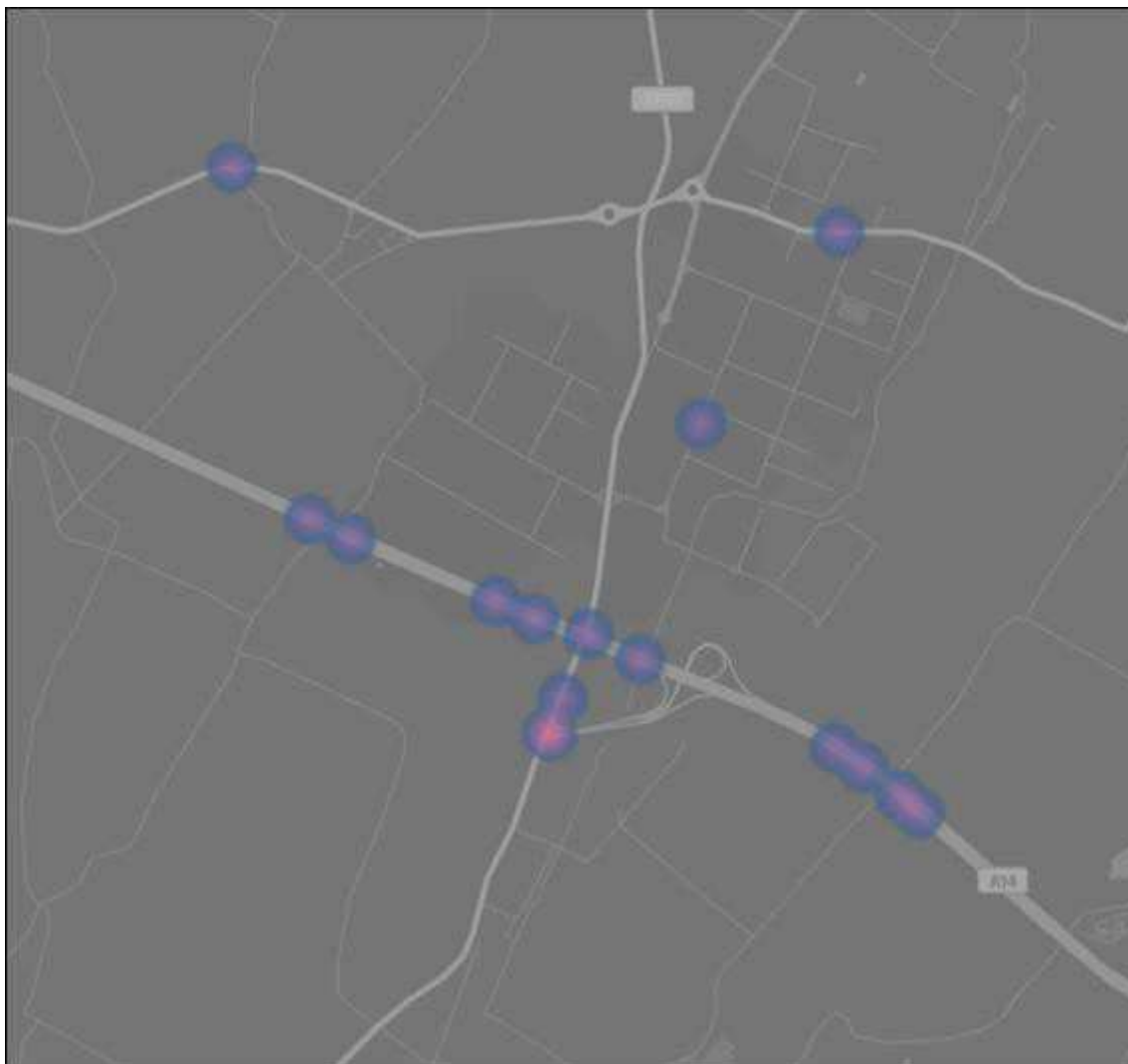
Img. 1.1.1 –Mappa di densità degli incidenti stradali sul territorio dei comuni di Castel San Pietro Terme e Castel Guelfo, anno di riferimento 2019

Quanto alla compatibilità dei flussi di traffico sulla rete con le funzioni circostanti, si ritiene che il traffico veicolare generato dai nuovi comparti che si andranno a insediare all'interno del Polo San Carlo, in particolare i mezzi pesanti, seguiranno itinerari sulla viabilità principale (SP n.19, Autostrada A14, SP n.31) tali da non interferire con aree residenziali.