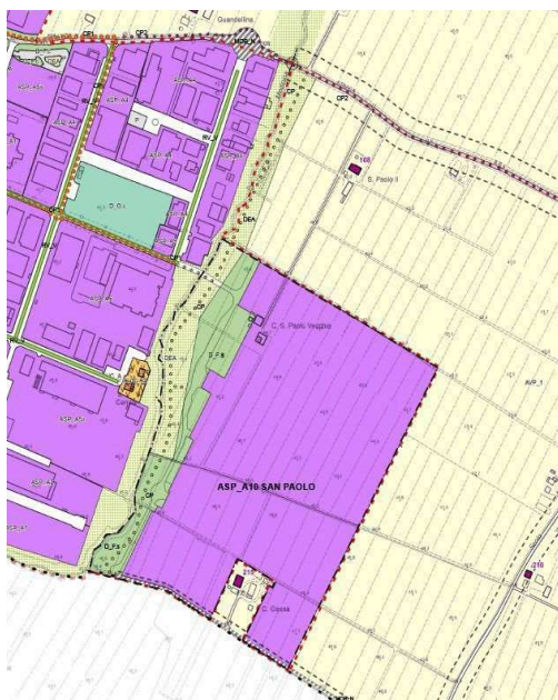
ASP_A10 SAN PAOLO

Le aree sopra citate sono destinate dalla variante P.S.C. – R.U.E., parte come Ambiti produttivi sovracomunali di sviluppo inseriti nell’HUB Metropolitan San Carlo , parte DEA e D_Fs.